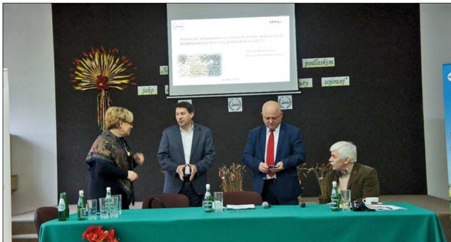
Organizatorzy warsztatów agrotechnicznych