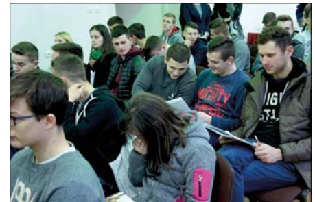
Studenci WSA i uczniowie szkół uczestniczący w warsztatach

W czasie przerwy każdy z uczestników warsztatów miał możliwość wymiany własnych doświadczeń z uprawy roślin bobowatych z przedstawicielami firm hodowlanych, jak również z przedstawicielami firmy Agrocentrum i TRANS-ROL oraz z pracownikami SDOO Krzyżewo. Wszyscy uczestnicy warsztatów agrotechnicznych otrzymali materiały promocyjne firm uczestniczących w spotkaniu. Była również możliwość obejrzenia nasion roślin