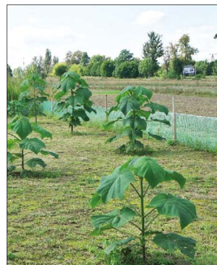
Poletko oxytree w WSA Łomża. Zdjęcie autorskie z dnia 29.08.2017 r.

W okresie od 19 maja do 4 października 2016 r. a więc w ciągu 138 dni średnia wysokość drzewa wyniosła 106 cm przy średniej grubości pnia 28 mm. Po pierwszych przymrozkach liście oxytree zbrunatniały i opadły.